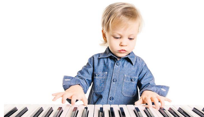
▲ De lesmethode 'Klavierleeuwen' is geschikt voor leerlingen vanaf 4 jaar.

gen naar Utrecht veel met elkaar daarover gesproken. Daar ontstond het idee om met dieren te werken die ieder kind kent.”